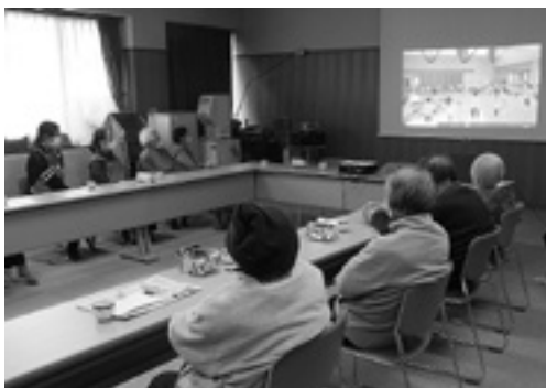
熱心に見入るふれあいサロンの皆さん

毎年はずらつとした姿を楽しみにしていた利用者には、この上ないサプライズになり、今年は交流がないものと諦めていた