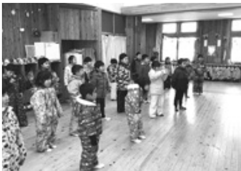
南保育園の皆さん

方からは、「とても嬉しかった、元気を付けてもらった」とのお声。新型コロナ感染予防のため、直接の交流は叶わなくても、工