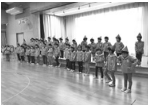
北保育園の皆さん

毎年はずらつとした姿を楽しみにしていた利用者には、この上ないサプライズになり、今年は交流がないものと諦めていた