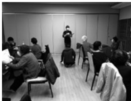
皆さん、熱心に聞いてます

コロナ禍においては、人と人との接触について、配慮しなければならぬことが多くなりました。「心のつながり」まで無くしてしまわないように、今後も感染に注意しながら、交流が図れるよう、さまざまな事業で工夫をしていきたいと思