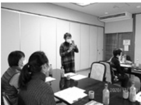
ボランティアさんの意見発表

参加者同士で会話を楽しむ時間には、「久しぶりに人とたくさん話をした」という参加者もいて、交流の機会が少なくなっている実情を感じました。