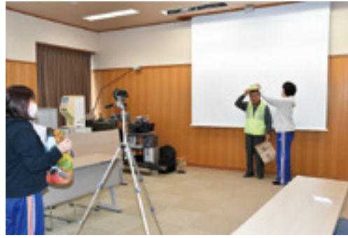
メッセージ動画の撮影風景