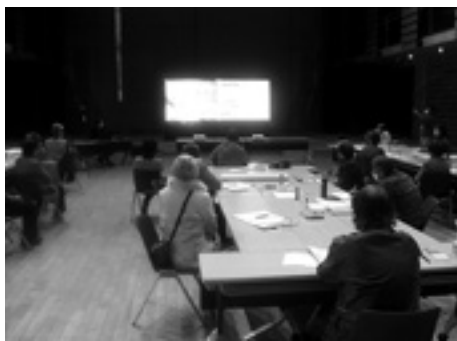
県内の取り組みについて聞きました

皆さんは、「地域の縁側」をご存じですか？松川村にもたくさんあります。隣近所の住民同士が気楽に集う場所のことで、お茶やおしゃべりを通じ、地域の交流が行われるところです。例えば、安曇野市堀金地区では、「ゴミ収集の朝、ゴミ置き場