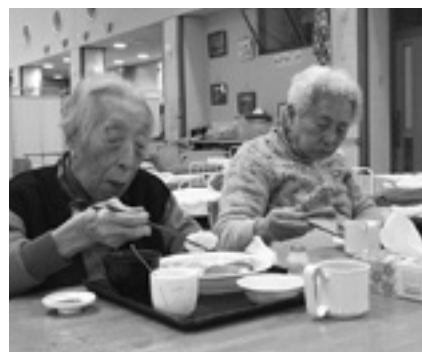
やっぱり、お寿司はいいね

今年は、新型コロナウィルス感染防止対策を十分に行い、利用者の方々に、にぎり寿司を味わっていただきました。まぐろ・えび・ほたて・サーモンなど数種類のお寿司が用意され、それぞれに好みのお寿司をお代わりされていました。「おいしかった」「久しぶりにお寿司が