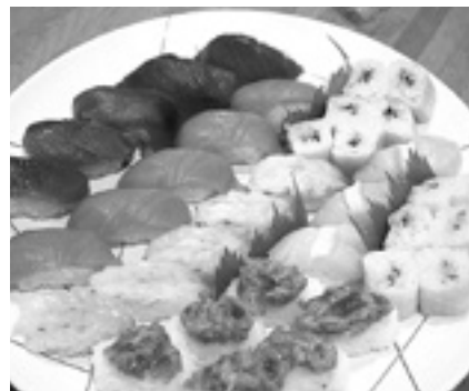
当日のメニューです

食べられて、嬉しかった」と、たいへん喜んでいただきました。ご高齢の皆さんは、現在のような状況下では外食はもちろん外出さえままなりません。少し