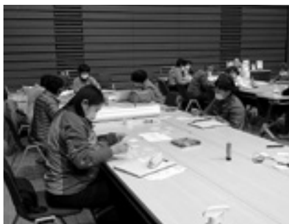
歩いて分かった村のいいところをまとめました

今年度のテーマは、「コロナ禍でのボランティア活動」です。今年の4月以降、ボランティア活動が自粛になるなか、それぞれの市町村ではさまざまな工夫を凝らした取り組みが行われており、今回はその発表の機会となりました。松川村では、小学生のボランティア活動を紹介します。8月下旬から9月上旬に、安曇野ちひろ体