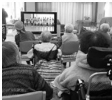
ビデオレターに笑顔

昼食の献立は、クリスマス特別料理。お茶の時間ではケーキと紅茶を食べて、「とてもお