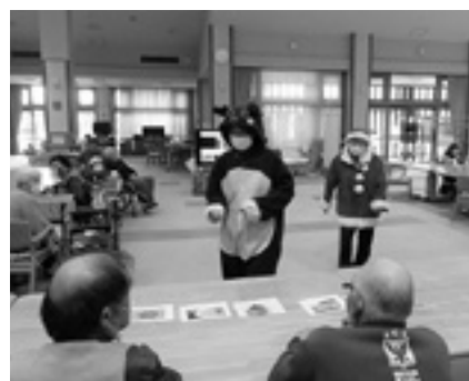
クリスマス会での楽しいひと時

いしかったよ」との言葉をいただきました。利用者皆さんに喜んでいただき、クリスマスを堪能していただくことができました。