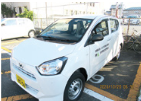
受領した福祉巡回車

きたとのこと。長年の取り組みに敬意を表すとともに、今回の寄付に感謝申し上げます。村の福祉推進のため、大切に活用させていただきます。