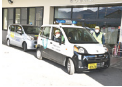
青パト、さあ出発です

例年、南北保育園を訪問し、レクリエーションなどを通じて顔を覚えてもらっていましたが、